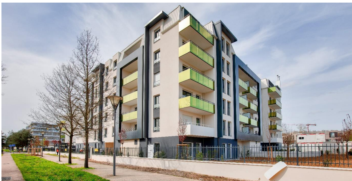
Résidence Botticelli – Aulnay-sous-Bois

1001 Vies Habitat livre la résidence intergénérationnelle Botticelli à Aulnay-Sous-Bois, pour pallier la sous-occupation. Cette résidence se compose de 48 logements adaptés pour les seniors et les personnes à mobilité réduite, 32 logements sociaux familiaux et une Maison des Projets du dispositif intergénérationnel Chers Voisins.